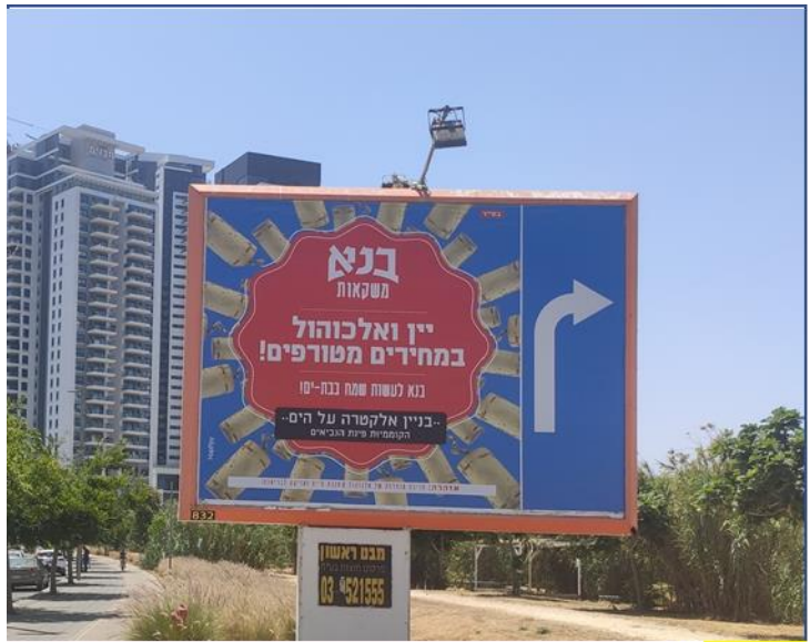
קוממיות / תאיו 10

חתימת וחותמת המציע המעידים על אישור הסכמה קריאה והבנת המוזכר בעמוד זה: _____