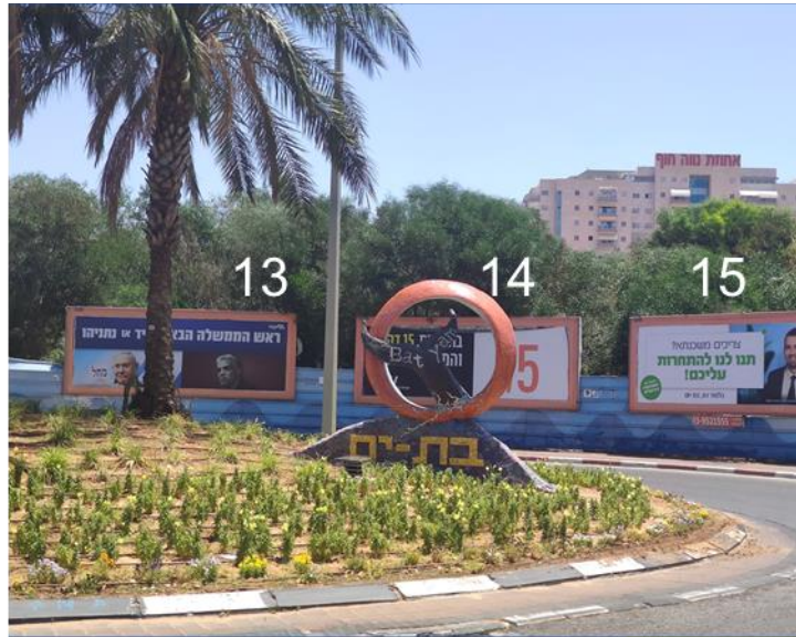
13-15 דרך בגין כניסה מראשל"צ