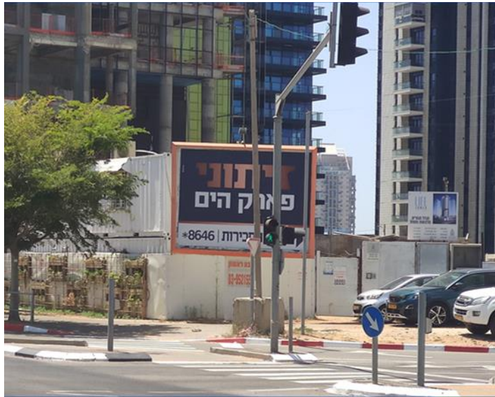
11 קוממיות נביאים