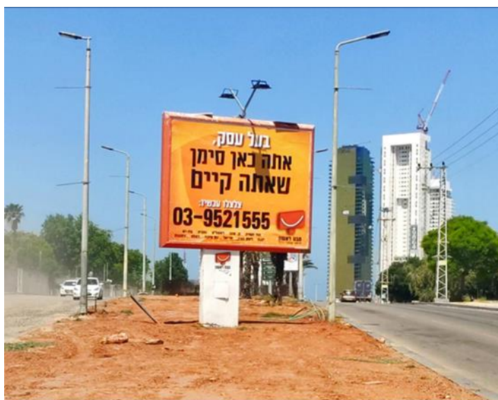
קוממיות / אנה פרנק