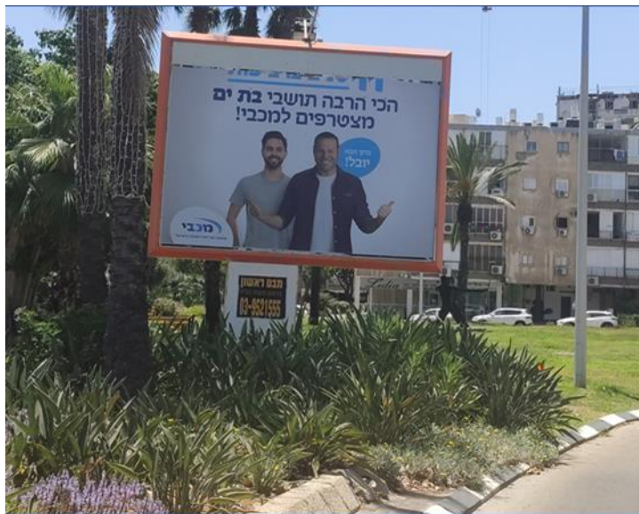
12 הרצל כניסה מיפו

חתימת וחותמת המציע המעידים על אישור הסכמה קריאה והבנת המוזכר בעמוד זה: _____