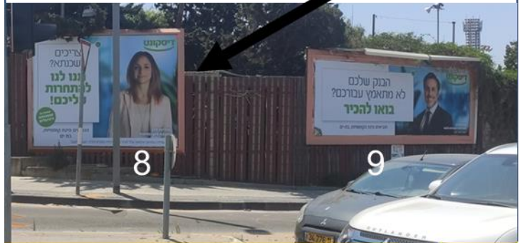
קוממיות דרך בגין 5-9