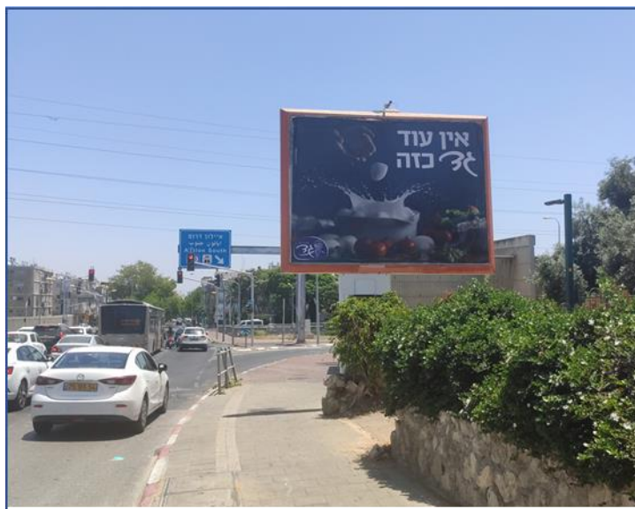
קק"ל בסמוך לכביש 20