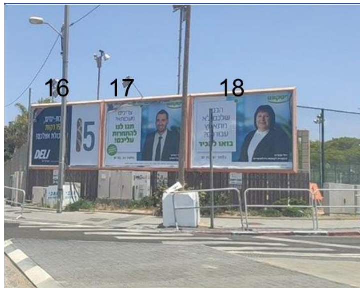
16-18 דרך בגין כניסה למרכז נופש

חתימת וחותמת המציע המעידים על אישור הסכמה קריאה והבנת המוזכר בעמוד זה: _____